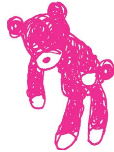
キャラクター ぐったりくまちゃん