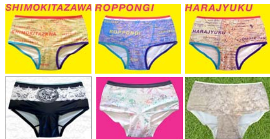
サニタリーショーツ全6種